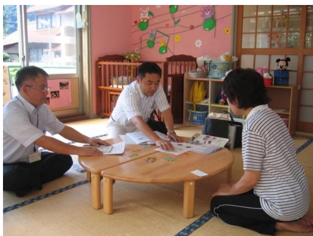
阿須那保育所での様子

邑南町では公民館活動が盛んで、毎年イベント補助を活用していただいています。公民館や保育所などを主に回り、今年三江線利用の予定やいつも活用していただいている上でのご意見などもいただきました。（三江線利用はゆっくりとしたテーマの時に良い、体験+学習がよいので三江線+αが欲しい、活性化案としてポイント制はどうか・ゆっくり走るので列車の中で将棋ができる将棋列車はどうか、子どもの団体時での切符の購入の仕方は?…など。）