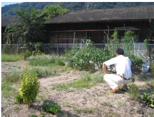
式敷駅近くの空き地。 一部畑にしてお世話されている。

その中で式敷駅は、沿線住民の方が交代で駅舎の掃除をしたり、駅近くの市の土地（空き地）の草刈りや野菜を作ったりなどの活動を行っておられます。