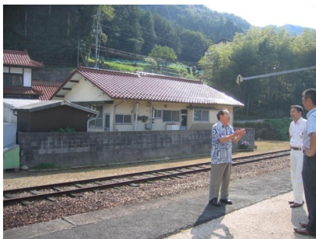
綺麗に草が刈ってある敷地内。 近所の奥さんがご厚意でやってくさっている。